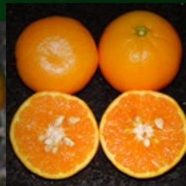
MURCOTT SETE LAGOAS