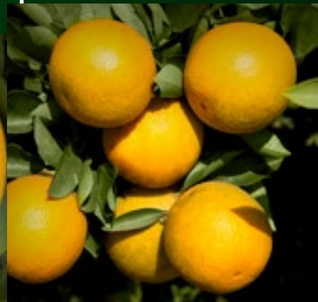
NATAL SETE LAGOAS