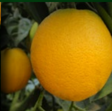
BAIA LANE LATE SETE LAGOAS