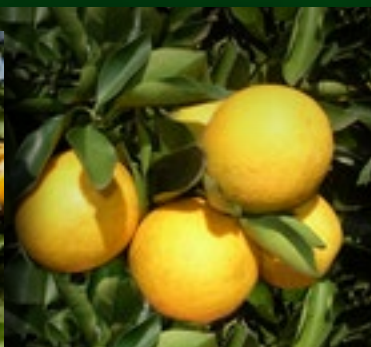
PÊRA BIANCHI SETE LAGOAS