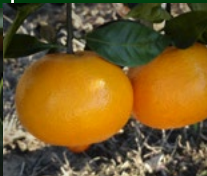
MURCOTT OLÉ SETE LAGOAS