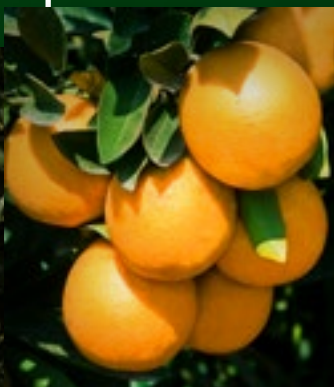
VALÊNCIA SETE LAGOAS